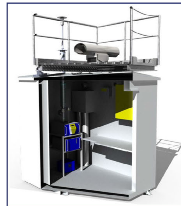
Bilden visar BOO PM10 & NO2 version

Utöver ovanstående standardversioner finns möjlighet till fler varianter på begäran.